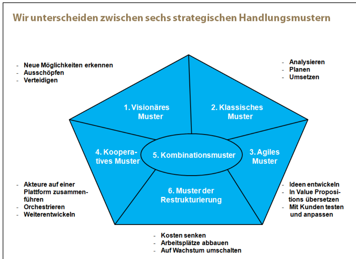
Abbildung 1: Strategische Handlungsmuster