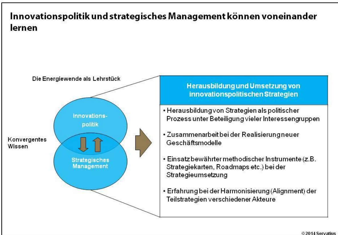
Abb. 1: Innovationspolitik und strategisches Management