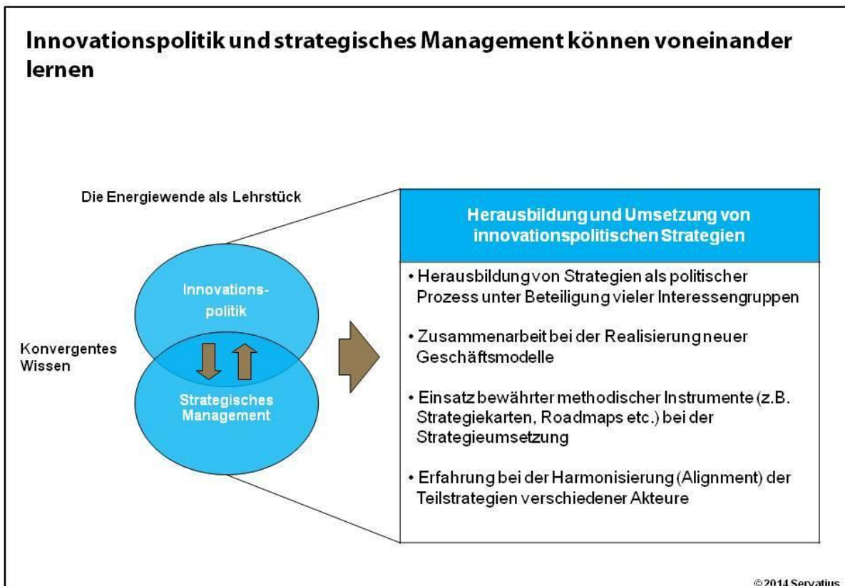
Abb. 1: Innovationspolitik und strategisches Management